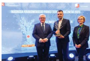
Nagroda KPT w kategorii Największa inwestycja ubiegłego roku

Nagrody biznesowe otrzymane przez spółkę Velvet CARE: