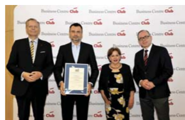
Ambasador Polskiej Gospodarki w kategorii Marka Europejska przyznawany przez Business Centre Club