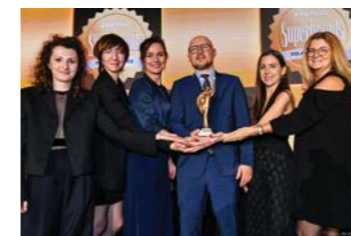
Superbrands 2024 dla marki Velvet

Nagrody przyznane za działania marki Velvet: