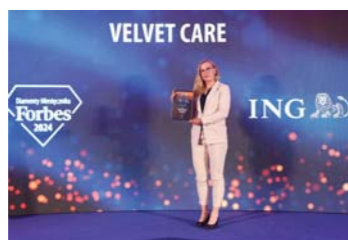
Diamenty Forbesa w kategorii największych przedsiębiorstw (sprzedaż powyżej 250 mln zł)