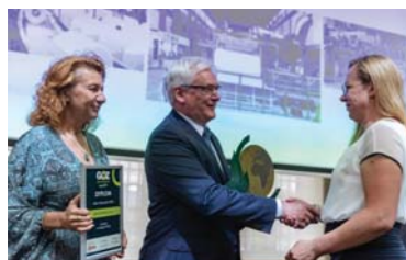
GOZ Biznes – Lider Małopolski 2024