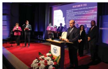
Wyróżnienie w konkursie „Pracodawca – organizator pracy bezpiecznej”

Nagrody biznesowe otrzymane przez spółkę MORACELL: