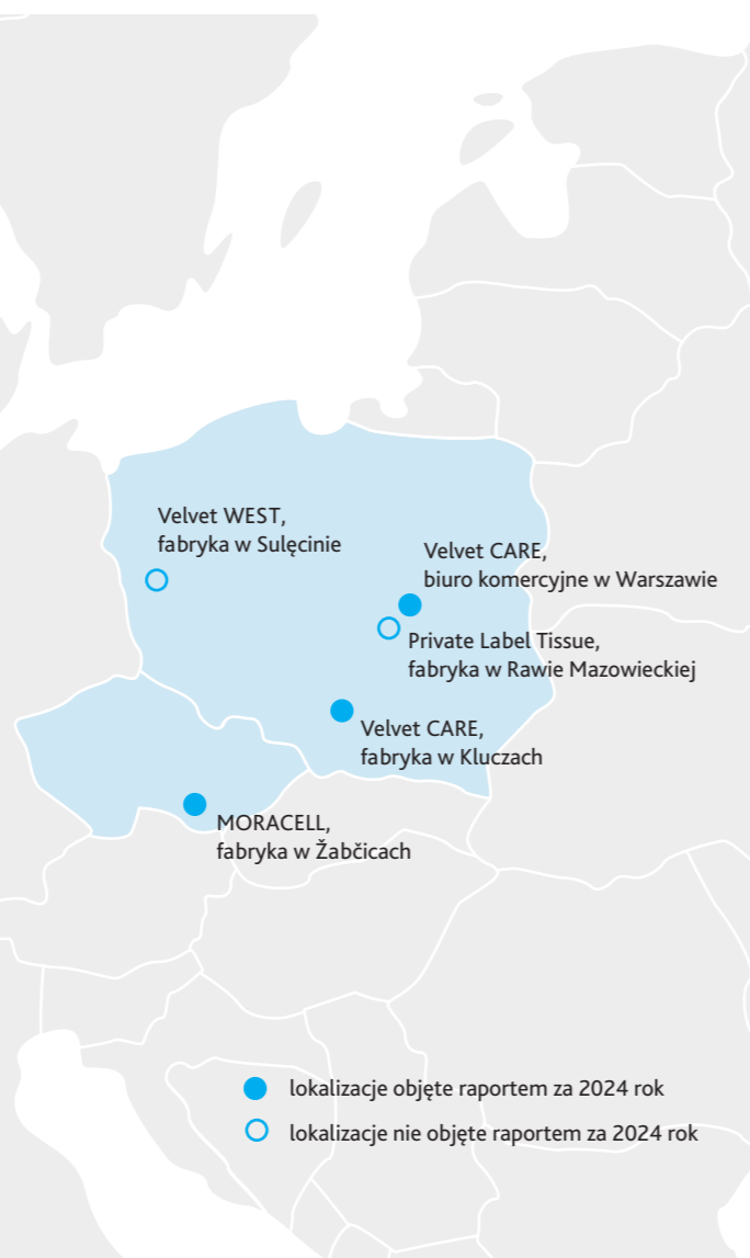
● lokalizacje objęte raportem za 2024 rok ○ lokalizacje nie objęte raportem za 2024 rok

MORACELL s.r.o. – firma zatrudniająca ponad 115 osób z siedzibą w Žabčicach k/Brna w Czechach. Jest największym producentem papierowych wyrobów higienicznych w swoim kraju.